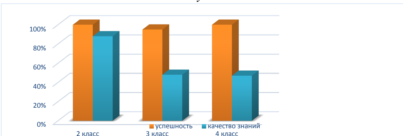
Диаграмма 2. Успешность и качество знаний учащихся начальной школы за 2021-2022 учебный год

Высокие результаты качества знаний в следующих классах: 2 класс – качество знаний 88%, но ниже других классов успеваемость в 3 классе 95 %