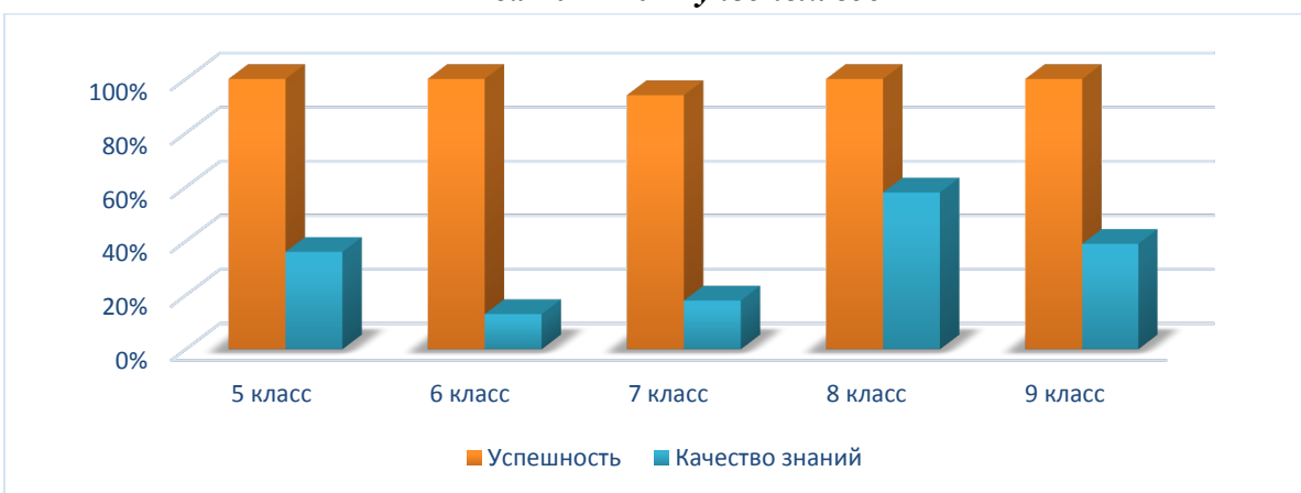
Диаграмма 3. Успешность и качество знаний учащихся основной школы за 2021-2022 учебный год

Высокий процент качества знаний показал 8 класс - 58%