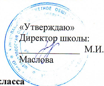
ГРАФИК промежуточной аттестации учащихся 4 класса на 2024-2025 учебный год