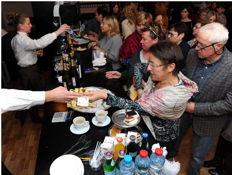
8. (Театральный буфет)