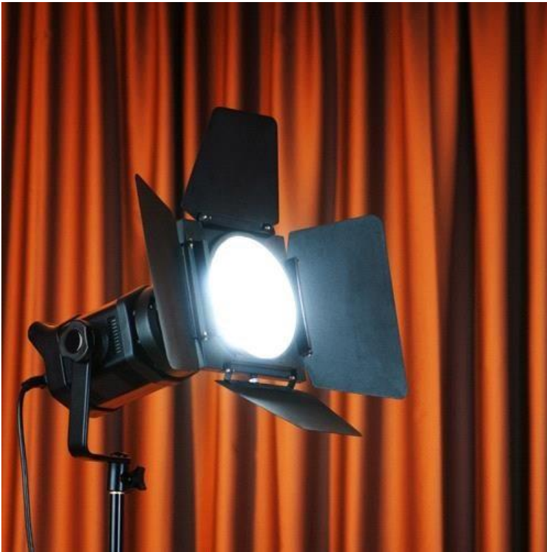
3. (театральный софит)