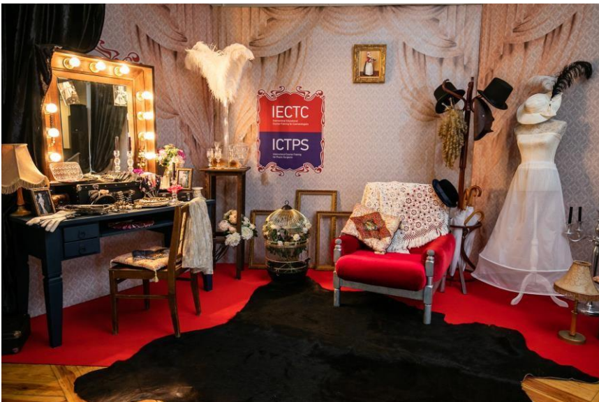
7. (Театральная гримёрка)