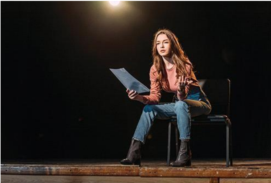
5. (актер, актриса)