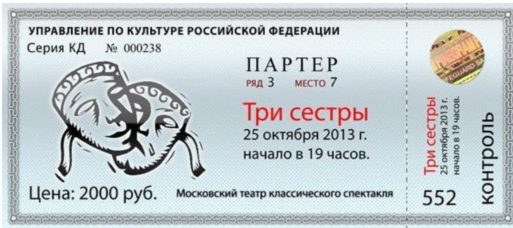
6. (Билет в театр)