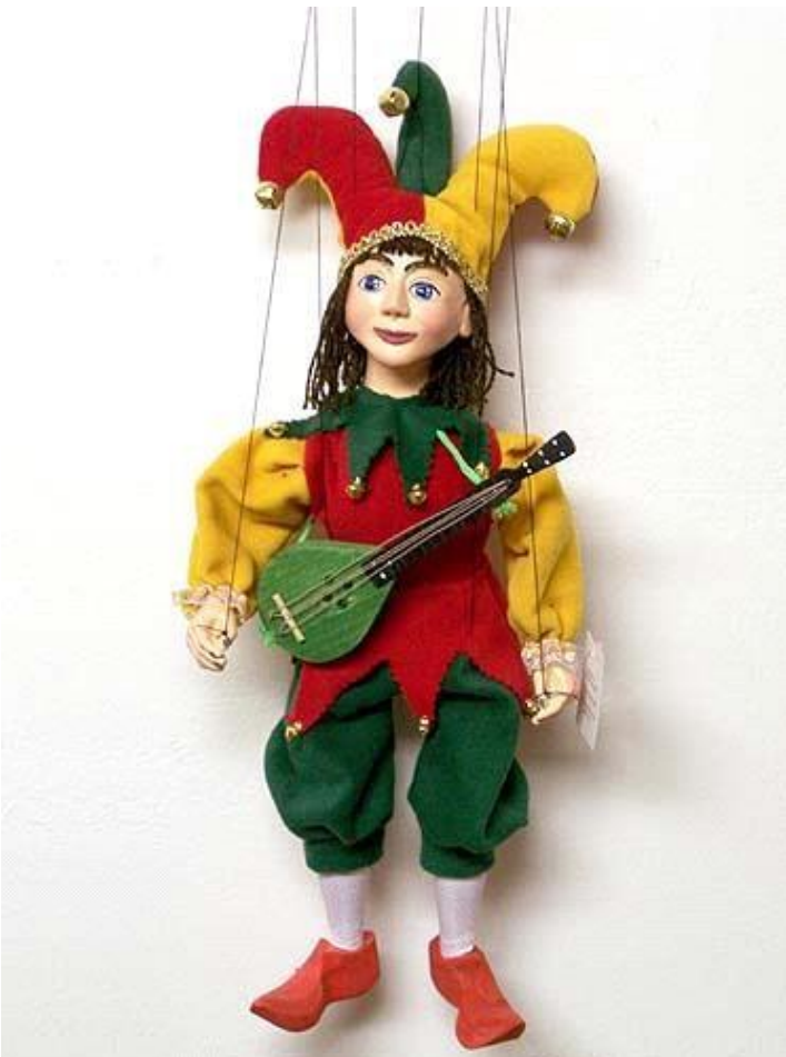
4. ( куклы марионетка)