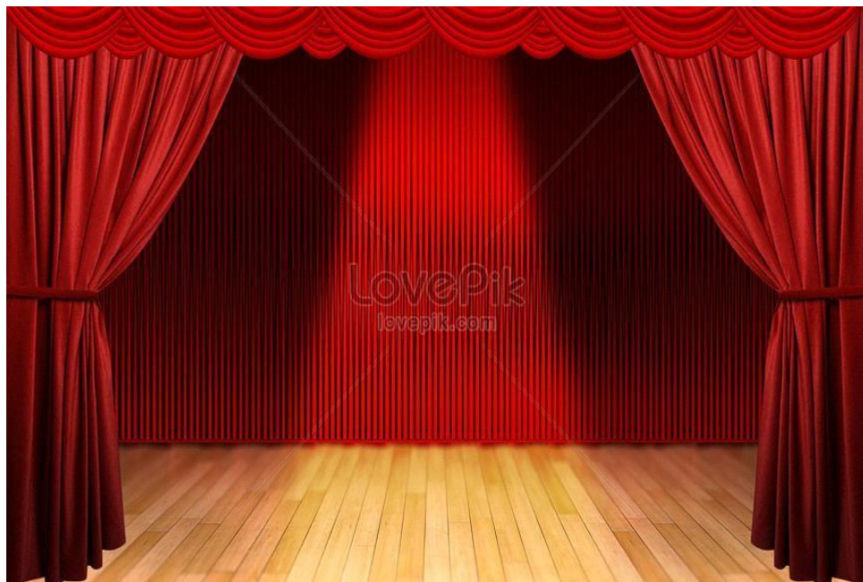
2. (сцена с кулисами)