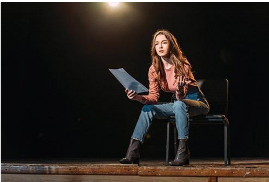
5.( актер, актриса)